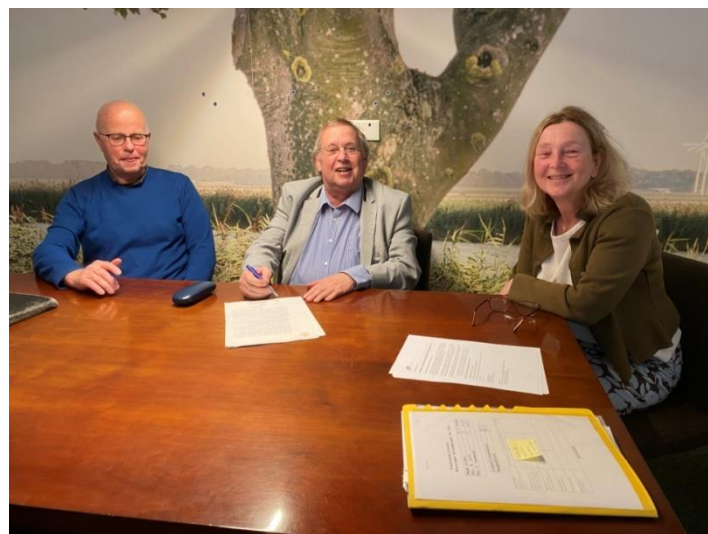
Ondertekening van de nieuwe statuten van Stichting en van de Vereniging

De vrijwilligers hebben vroeg in het voorjaar kleine, noodzakelijke snoeihandelingen verricht, zodat de bomen er weer een jaartje tegen kunnen. Nu maar hopen dat er bergen sappige appels, peren, pruimen en moerbeien van af komen!